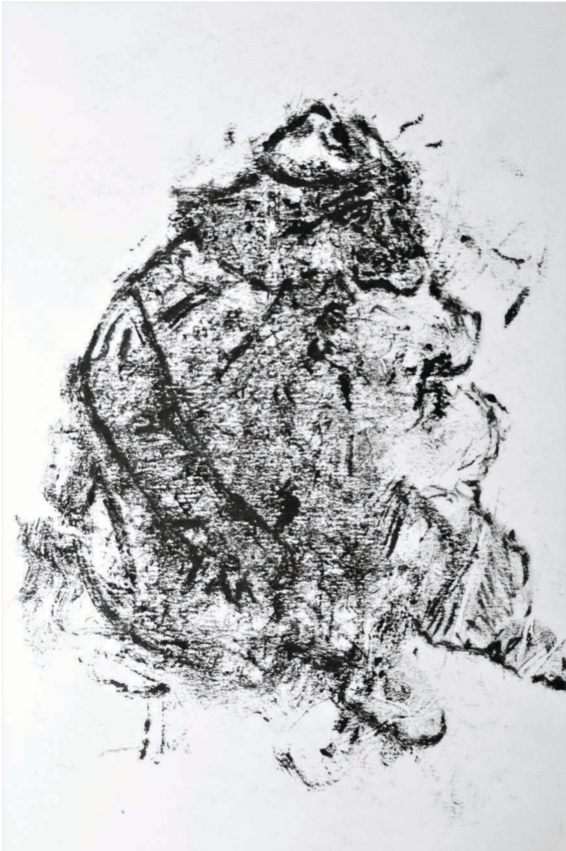
Illustrasjon av Anders Hagen