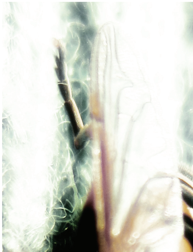
Illustrasjon: Ashild Aurlien

og rettmessig så. Men Søvik og Davidsen er samtidig uttalt kritiske til en såkalt « God of the gaps », det vil si en Gud som finner sin begrunnelse ved å fylle «hull» i vitenskapelige forklaringer. Dette fremgår blant annet av deres diskusjon av William Paleys designargument (s. 65–72). En « God of the gaps » brukes til å forklare fenomener innenfor vitenskapens domene som vitenskapen selv foreløpig ikke klarer å forklare. En slik Gud bidrar i følge forkjemperne til vår forståelse av verden, men risikerer samtidig å bli overflødig så snart vitenskapen går videre. Et typisk eksem-