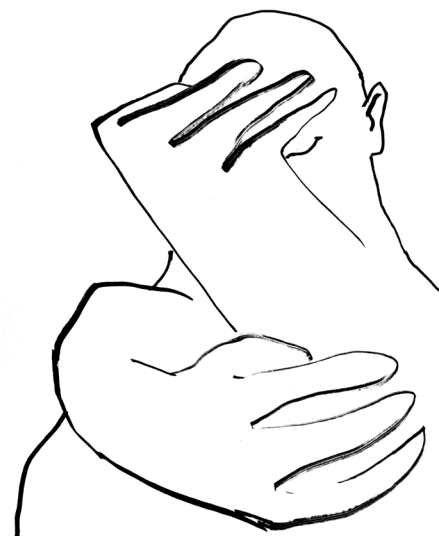
Illustrasjon: Marianne Røthe Arnesen

Kohlberg fylgjer opp med ei rad tilleggsspørsmål. Gilligan skuldar han for å tolke svara slik at dei byggjer opp under dei kjønnsbundne skilnadene i hans eigen moralteori og kritiserer Kohlbergs tolking på kvart punkt. Når dei vert bedne om å beskrive seg sjølve, måler Jake seg opp mot eit sjølvsentrert ideal om perfeksjon, medan Amy måler seg opp mot eit andresentrert ideal om omsorg. Når dei får spørsmål om korleis dei vil prioritera ansvar andsynes seg sjølve og andre, tek Jake utgangspunkt i lausriving i tilhøvet til andre menneske, og røkjer etter ulike former for tilknytning ut frå det, medan Amy tek utgangspunkt i tilknytning, for dinest å orientera seg mot lausriving. Det