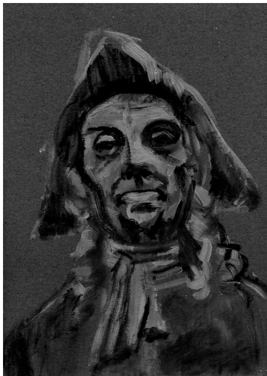
HOLBERGS MORALSKE KJERNE