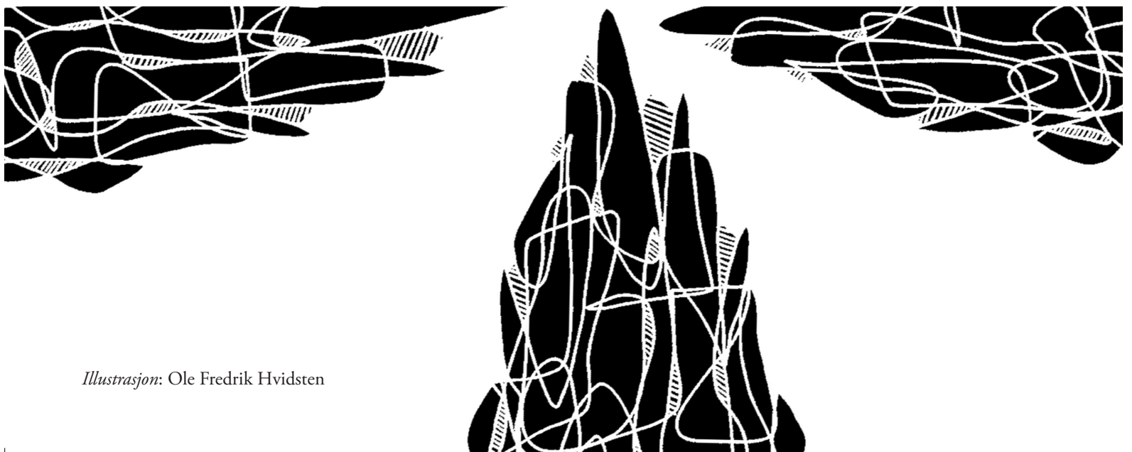
Illustrasjon: Ole Fredrik Hvidsten