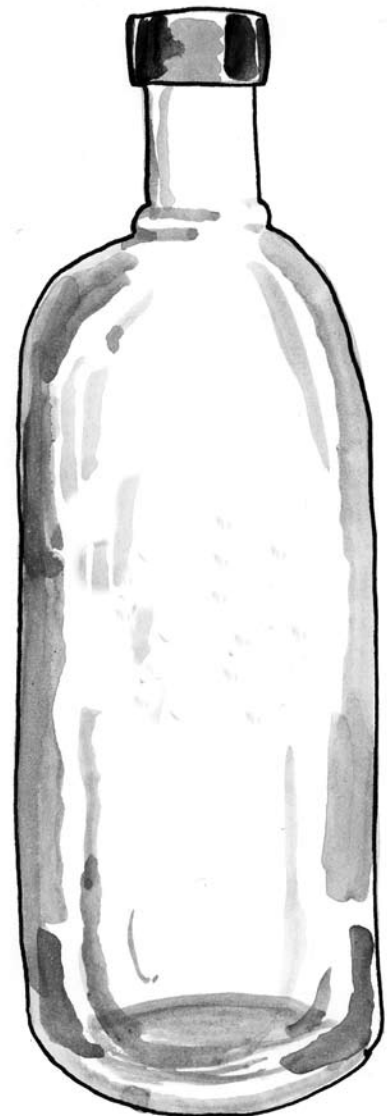
ILLUSTRASJON: MATS OMLAND

Wittgenstein, L. 1997, Filosofiske undersøkelser , utdrag; § 243-§ 309, Pax Forlag.